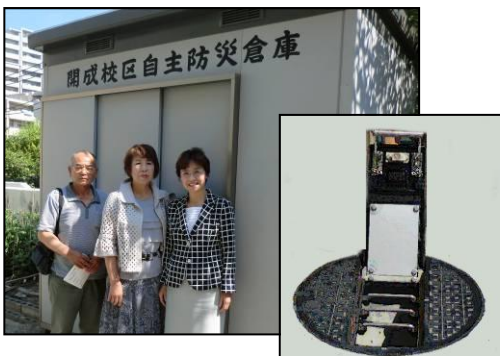
防災倉庫とマンホールトイレ