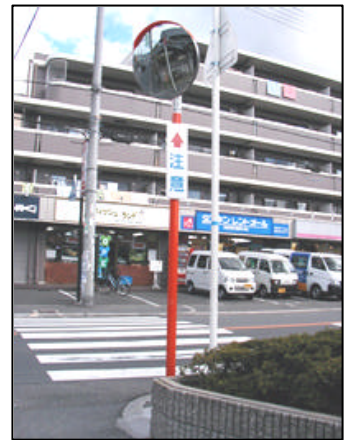
山之上四丁目24付近(カーブミラー設置)