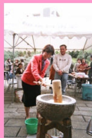
稗尊時団地自治会の餅つき 大会で餅つきの初体験