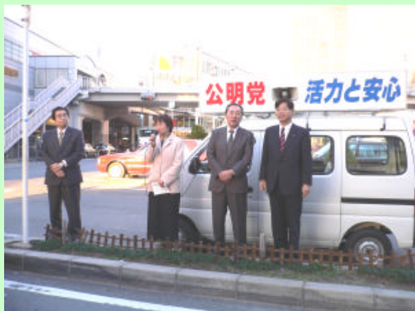
1月2日新年街頭演説会を枚方市駅