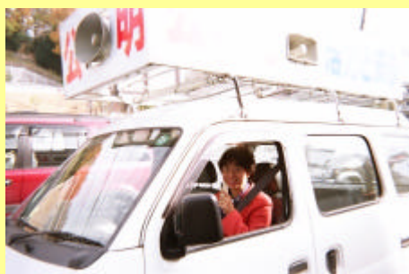
街宣カーで地域中にアピール