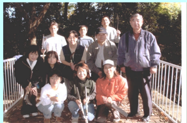
東開成地区の皆さんと地域の清掃