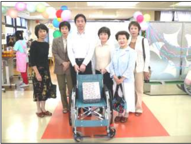
(車椅子とお手玉の贈呈)

ひまわりグループの皆さんで4年半にわたり、地道に空き缶のプルトップ回収を続け、購入した車椅子1台を特別養護老人ホーム・香里いちょう園に贈呈されました。またお手玉50個とタオル150枚を贈呈されました。